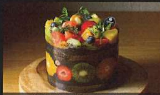
漆黒のこぼれるデコ

4号: 4,200円 / 5号: 5,200円 6号: 6,600円 / 7号: 8,200円