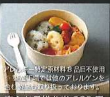
アレルギー特定原材料8品目不使用 *食品アレルギーは他のアレルギーを 含む食品も取り扱っております。 安心お子様弁当 880円