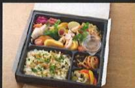
堀他彩り御膳 (あさりご飯) 2280円

※こぼれるデコは、周りのフィルムを剥がすと上のフルーツとソースがこぼれ落ちます。 大きさの目安 (およその直径) 4号: 12cm / 5号: 15cm / 6号: 18cm / 7号: 21cm