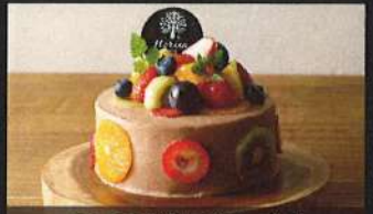
チョコポタニカルデコ

4号: 3,400円 / 5号: 4,400円 6号: 5,700円 / 7号: 7,400円