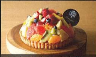
八百屋さんのフルーツタルト

4号: 3,400円 / 5号: 4,600円 6号: 6,000円 / 7号: 8,000円