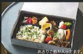
季節のご飯幕の内弁当 1580円