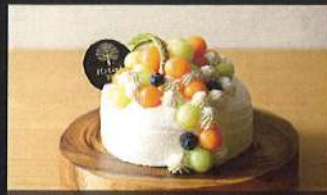
メロンドームデコ

4号: 5,000円 / 5号: 6,200円 6号: 7,500円 / 7号: 8,800円