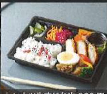
トンカツ牛すじ弁当 980円