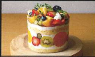
フルーツこぼれるデコ

4号: 4,800円 / 5号: 6,200円 6号: 7,500円 / 7号: 8,800円