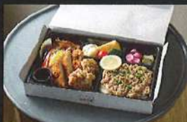
堀他彩り肉御膳弁当 1780円