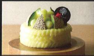
マスクメロンスペシャルデコ

4号: 4,000円 / 5号: 5,000円 6号: 6,500円 / 7号: 8,000円