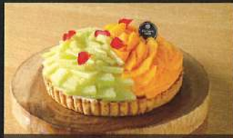
宮崎マンゴーとメロンのタルト

商品のお受取、お支払いは、道の駅内灘サンセットパーク (Horita205 内灘店 9:00 ~ 17:45) でお願いいたします。