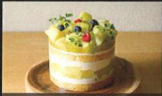
メロンこぼれるデコ

4号: 3,200円 / 5号: 4,500円 6号: 5,800円 / 7号: 7,800円