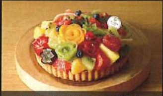
フルーツスペシャルタルト

4号: 3,400円 / 5号: 4,600円 6号: 6,000円 / 7号: 8,000円