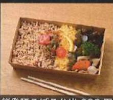
能登豚そぼろ弁当 980円