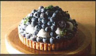
ブルーベリータルト

4号: 3,600円 / 5号: 4,600円 6号: 6,000円 / 7号: 7,800円