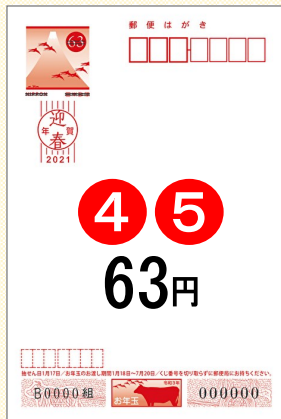
④ 無地 ⑤ 無地(くぼみ入り)