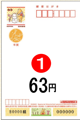
① ディズニー年賀 (インクジェット紙) ※裏面は無地です