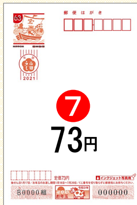
⑦ 無地(インクジェット写真用)