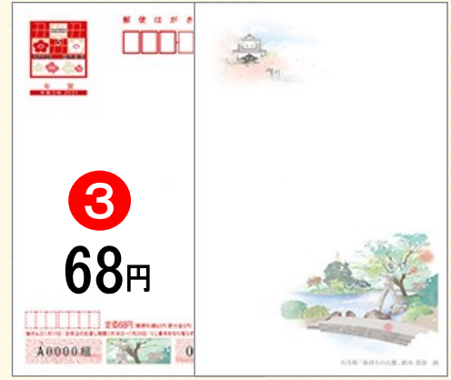
③ 絵入り[寄付金付] 石川県版 「春待ちの古都」 ※寄付金額は1枚につき5円です。