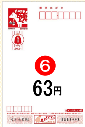
⑥ 無地(インクジェット紙)