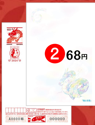
② 絵入り[寄付金付]全国版「龍と彩雲」 ※寄付金額は1枚につき5円です。