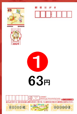
① ディズニー年賀(インクジェット紙) ※裏面は無地です