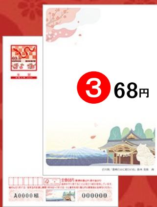
③ 絵入り[寄付金付]石川県版「霊峰白山に初日の出」 ※寄付金額は1枚につき5円です。